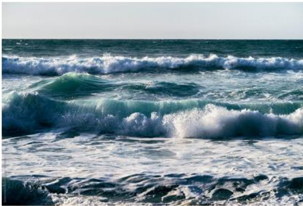
Valët e detit